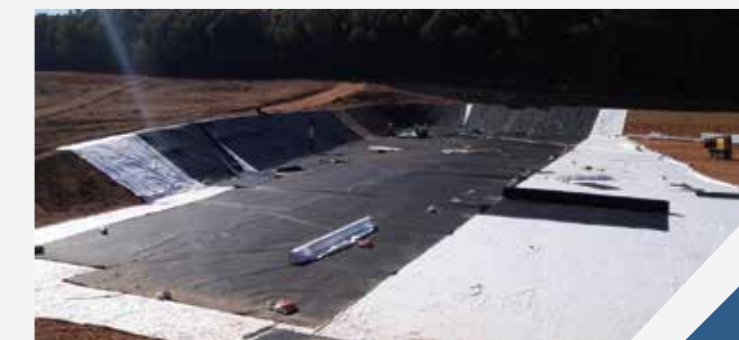
DÉCHARGE MOULAY BOUSSELHAM