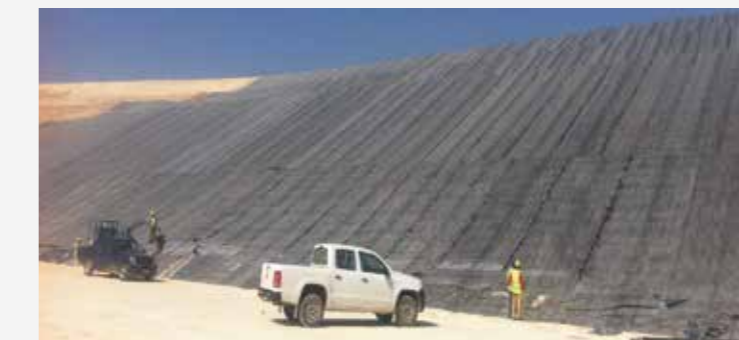
DIGUES D'ÉPANDAGE DES BOUES SUR LE SITE DE LA LAVERIE OCP HALASSA