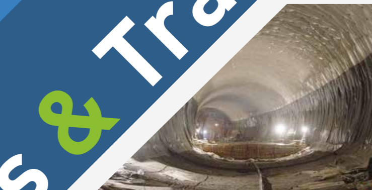
TUNNEL BORJ MOULAY OMAR MEKNES