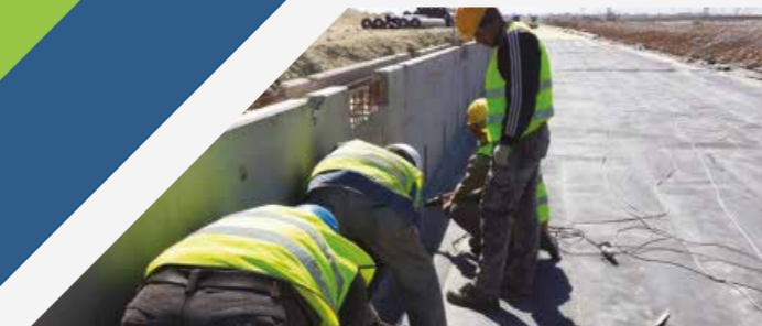
PROJET DOWN STREAM JORF LASFAR (STOCKAGE PHOSPHATES HUMIDES)