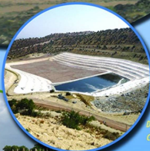
Décharge Publique Contrôlée d'Agadir