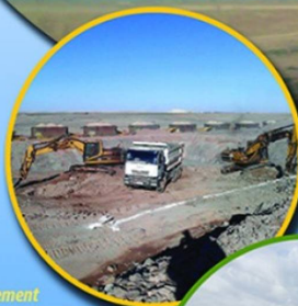
Aménagement et Réhabilitation du décharge Publique de benguerir